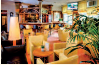
Hotelhalle mit Lobby-Bar

Raucher- und Nichtraucherzimmer, drei behindertengerechte Zimmer, Familienzimmer (mit Verbindungstür); Zimmer mit Doppelbetten, Einzelbetten oder Grand Lits; Bad mit Dusche oder Wanne-Dusche-Kombination.