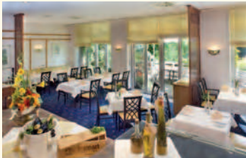
Restaurant „Wintergarten“ mit Terrasse